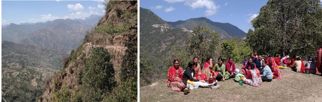
Pilotprojekt im Dorf Madane1 im Distrikt Gulmi

korrekt verlegt? Eine Gruppe von Haushalten wurde ausgewählt und eine Ansprechpartnerin benannt.