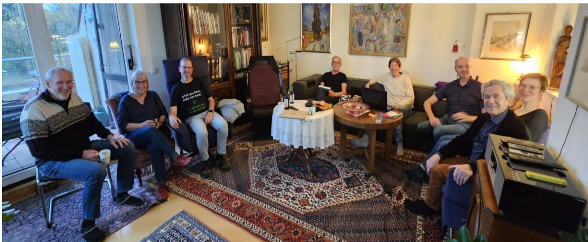
Wir sind fast vollzählig. Gleich geht es los.

Auf die Ofenmacher kommen zahlreiche Veränderungen zu und wir müssen darauf reagieren. Wir waren wir uns einig, dass wir ein gemeinsames Bild der Situation und der Treiber der Veränderung entwickeln und darauf aufbauend die Dinge selbst in die Hand nehmen müssen. Am 17. Und 18. November kamen elf Mitglieder des Vereins, darunter die fünf Vorstände, jeweils einen ganzen Tag zusammen.