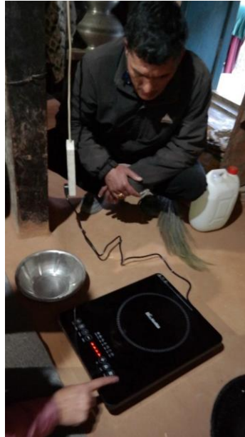
Energie-Mix in den Küchen

Mit Lehmöfen, Gaskocher und elektrischer Kochplatte kann man den gesamten Bereich der zur Verfügung stehenden Energien ausnutzen und möglichst „sauber“ kochen, aber bei technischen Problemen auf weniger „saubere“ Energiequellen ausweichen. Wir werden nun diskutieren müssen, in welchem Umfang die Ofenmacher die Einführung der elektrischen Kochplatten zusätzlich zu den Lehmöfen unterstützen können, um Nepal beim Erreichen seiner Umweltziele zu helfen.